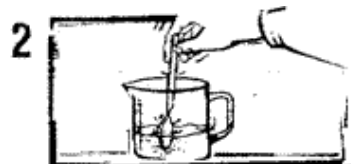
Fig. 1 e 2) aprire la bustina contenente l'esca e mescolare bene in una caraffa con circa 1 /2 litro di acqua tiepida (30 gradi)