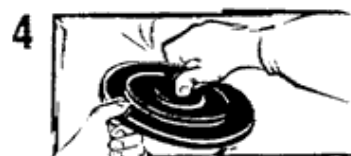
Fig. 3 e 4) tenendo FLY CITY in una mano, versare il liquido ottenuto nell'apposita busta di plastica, attraverso il foro posto al centro del coperchio. Assicurarsi che il liquido ottenuto raggiunga il livello indicato sulla busta di plastica. Altrimenti aggiungere altra acqua senza superare il livello indicato. Pulire l'esterno da eventuali residui. Coprire il foro sul coperchio con l'apposito tappo.