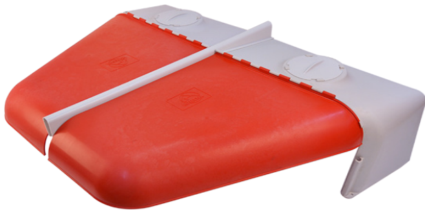
Ni-2 Córner Doble